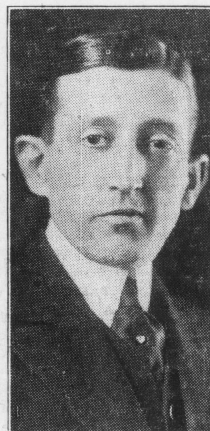
Will H. Hays