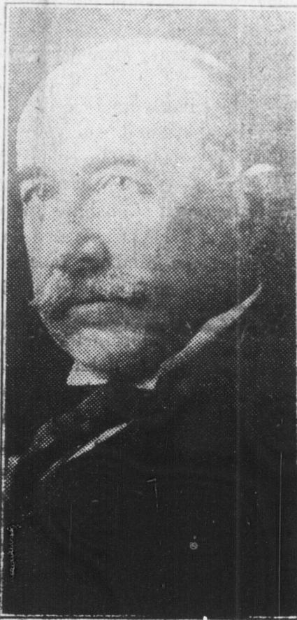
John Hays Hamond

Gli amici di costui che lo credevano più probabile alla carica di Segretario di Commercio nel Gabinetto Harding fu cancellato questa settimana dalla lavagna politica e vi fu aggiunto quello di Herbert Hoover di California.