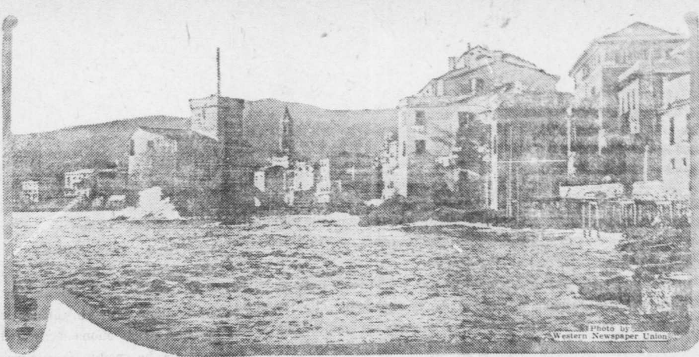
RAPALLO—uno dei più antichi quartieri della piccola cittadella.

“Contro il Trattato di Rapallo,” dice l'Epoca, “sono ventinove senatori, quattordici deputati ed un poeta, mentre a favore del Trattato sono tutti gl'Italiani che sentono la necessità d'un forte punto di sostegno, per spiccare il salto verso il futuro.”