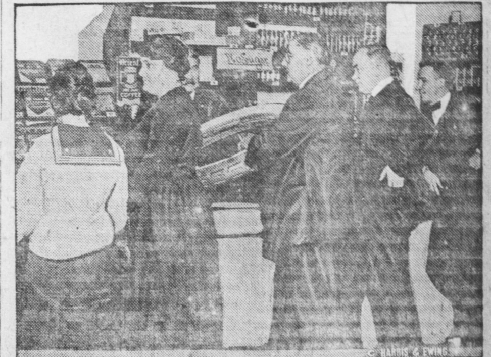
LA SCARSEZZA DI ZUCCHERO ALLA CAPITALE. Impiegati del dipartimento del Tesoro a Washington messi in fila, per comprare una libbra di zucchero.

zioni della Croce Rossa per rendere la vita di scuola più attrattiva per questi uomini. Nelle località sprovviste di dormitori scolastici i comitati locali della Croce Rossa potrebbero aiutare questi uomini a organizzare un club cooperativo dove le spese sarebbero ridotte ed i vantaggi sociali essere responsabili essi stessi dell'amministrazione della casa. Durante il noioso periodo della rieducazione professionale i divertimenti e le relazioni sociali piacevoli sono un fattore importantissimo per il benessere del mutilato. Altri servizi utilissimi già esistenti mantengono gli operai in relazione con gli uffici federali per la rieducazione dei mutilati, procurano prestiti, danno consigli, hanno cura delle famiglie dei mutilati per mezzo della "Home Service Section" nelle varie città.