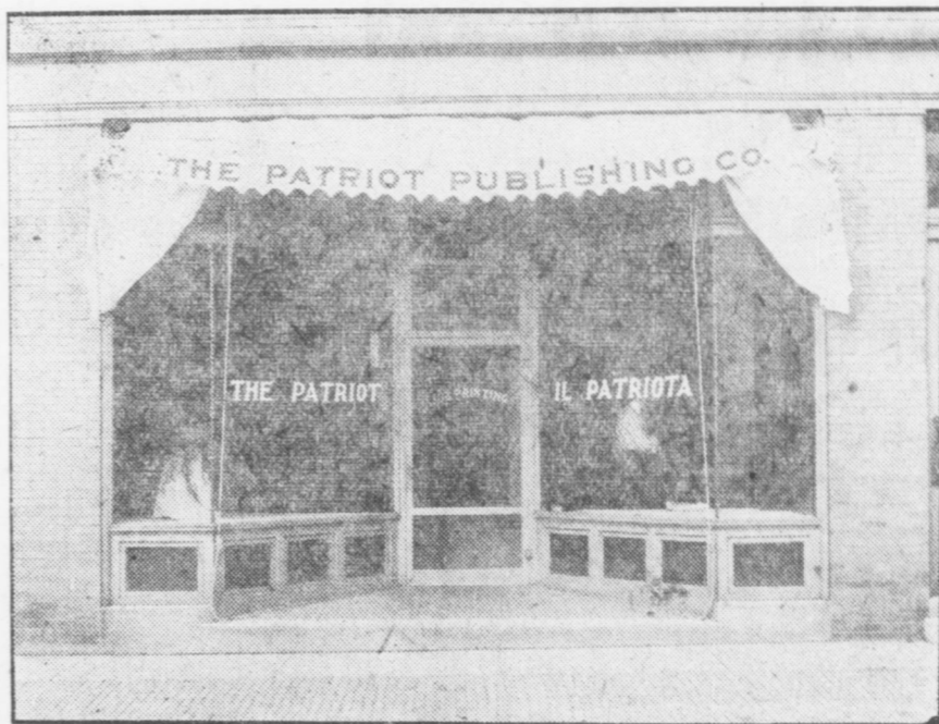
Uffici del "PATRIOTA" situati al No. 15 Carpenter Street

sono riconosciuti unici per Precisione Gusto Finezza