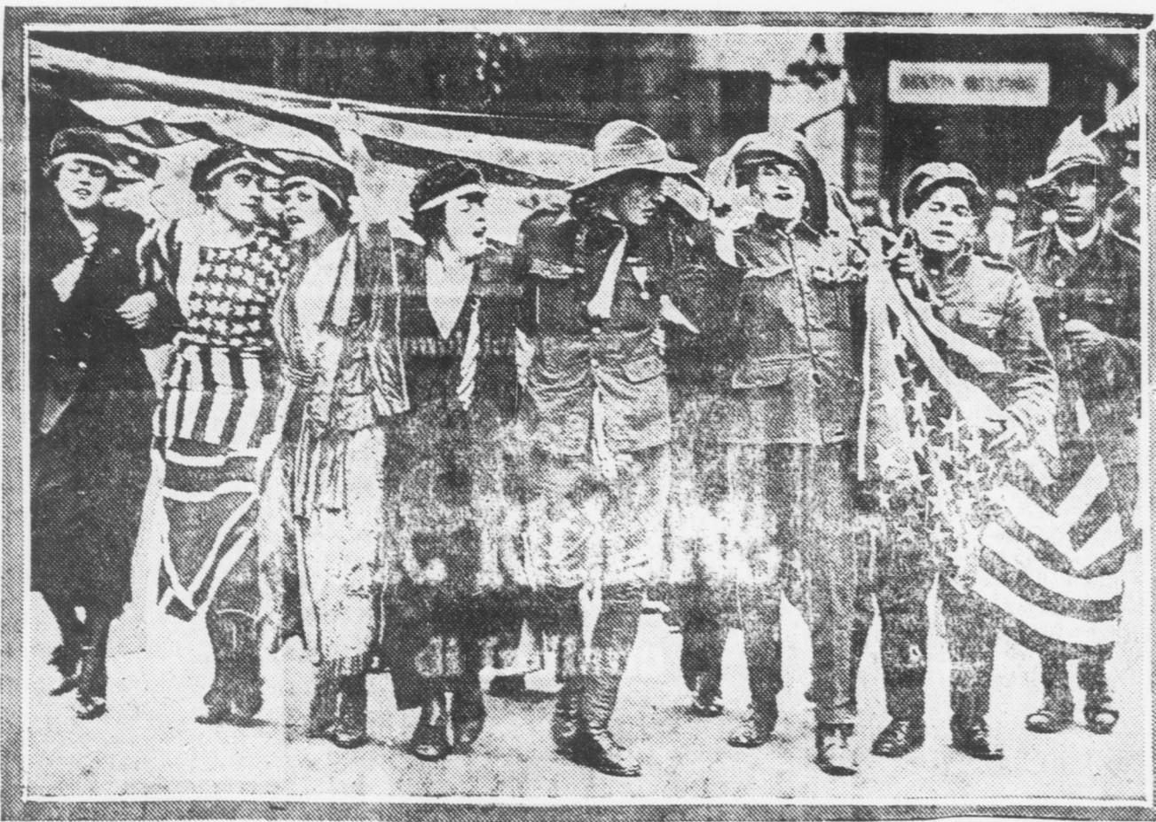
La bandiera dalle strisce e dalle stelle grandemente rappresentata durante la celebrazione del Giorno della Pace a Londra, Inghilterra.

Il giorno della pace celebrato a Londra.