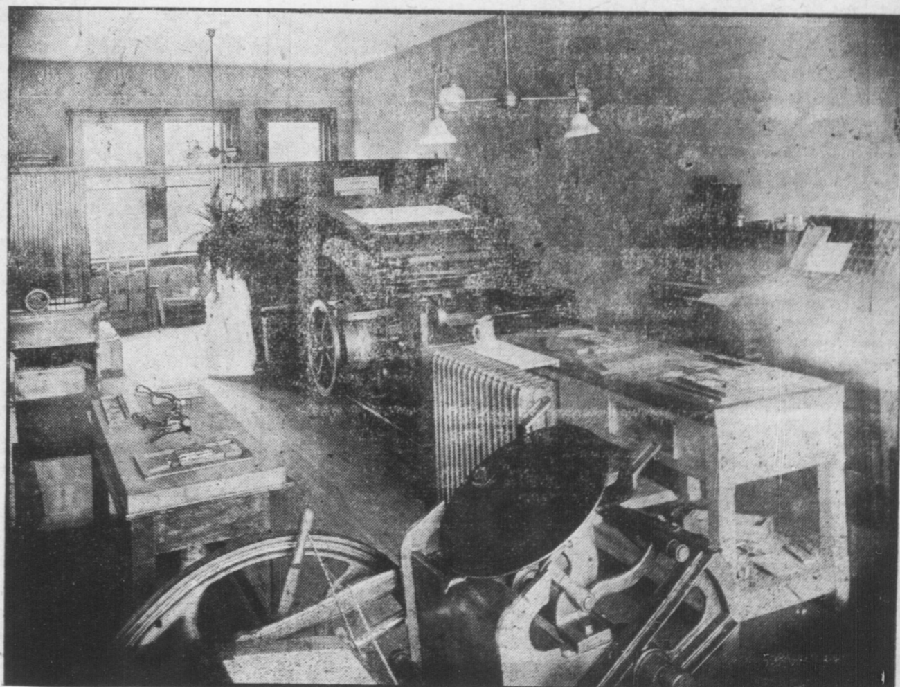
L'interno della Tipografia del "Patriota" corredata di macchinario modernissimo e tipi d'ultimo stile.

"IL PATRIOTA" e' il giornale letto ed apprezzato non solo negli Stati dell'Unione ma anche all'Estero