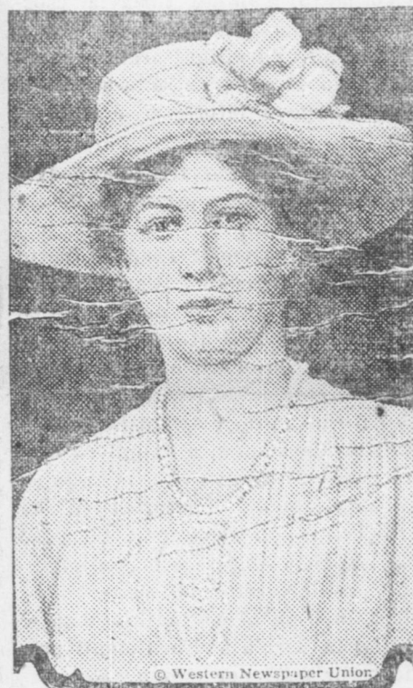
Recentissima fotografia della Principessa Maria di Inghilterra sola figlia del Re e della Regina ufficialmente fidanzata con il Conte di Dalkeith figlio del Duca di Buccleuch.

Le colonne del Patriota sono a disposizione dei nostri abbonati e lettori, specialmente degli operai per la cui difesa esso è sorto. Ci sarà grato se vorranno tenerci informati di tutto quanto tra essi avviene. In feste, in dolori, in lotte ci troveranno pronti ad assisterli, a guidarli, a consigliarli.