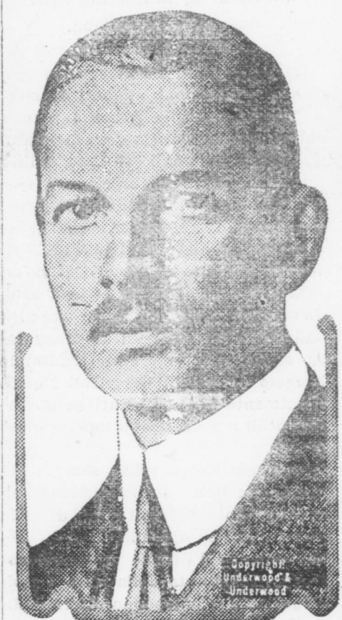
Dottore Cuno che ha succeduto Albert Ballin come Direttore della Linea Navigazione "Hamburg-American Line."