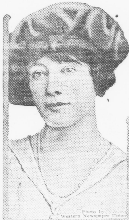
Marchesa Townsend moglie del Marchese di Townsend una famosa scrittrice inglese e la più bella donna della Inghilterra.