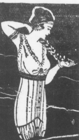
figure-outlines: Fashion's latest decree. A model for every figure, (each exclusive for its purpose) combining Slenderness, Grace and Suppleness, with long-wear, W. B. Nuform Corsets provide "Much Corset for Little Money."

Style 367 LOW BUST Price $2.00 (See left-hand illustration)