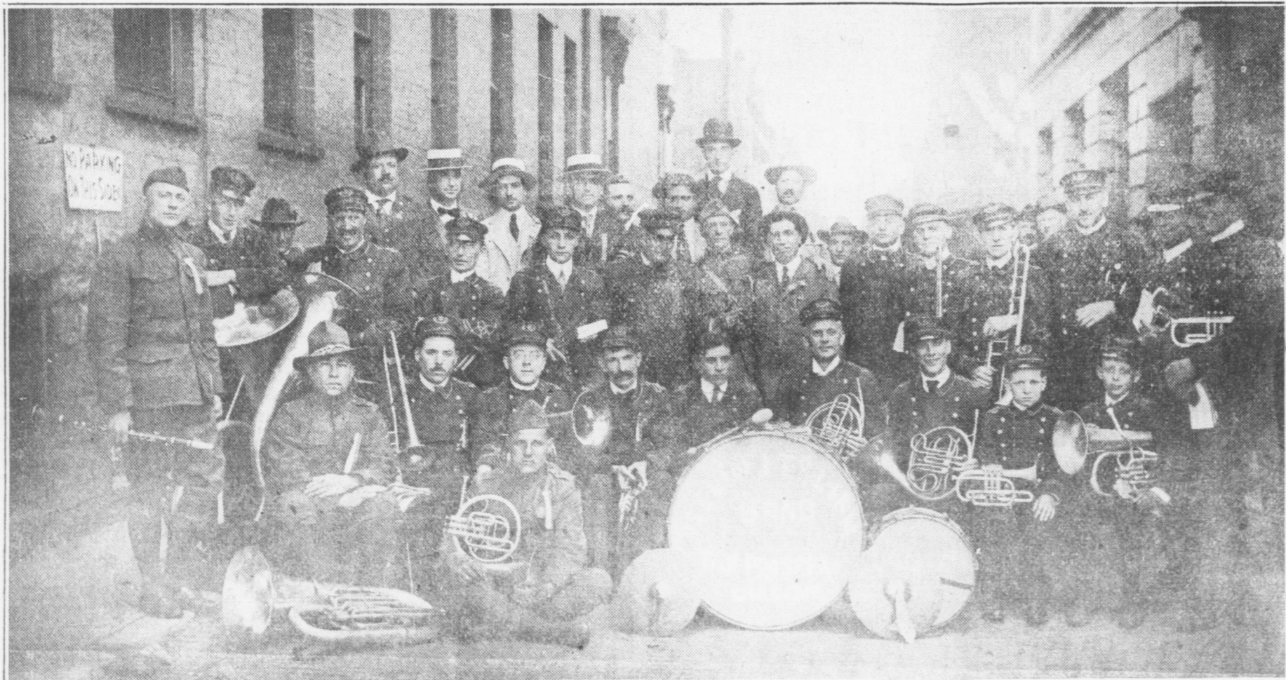
Gruppo della banda di Iselin e del Comitato.

Spedizione di monete in qualsiasi parte del mondo Servizio inappuntabile.