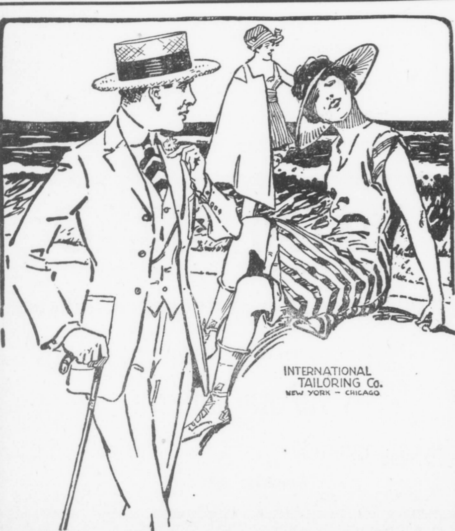
INTERNATIONAL TAILORING Co. NEW YORK - CHICAGO

Presso l'Australian Woolen Mill vicino la stazione dei carri Indiana, Pa.