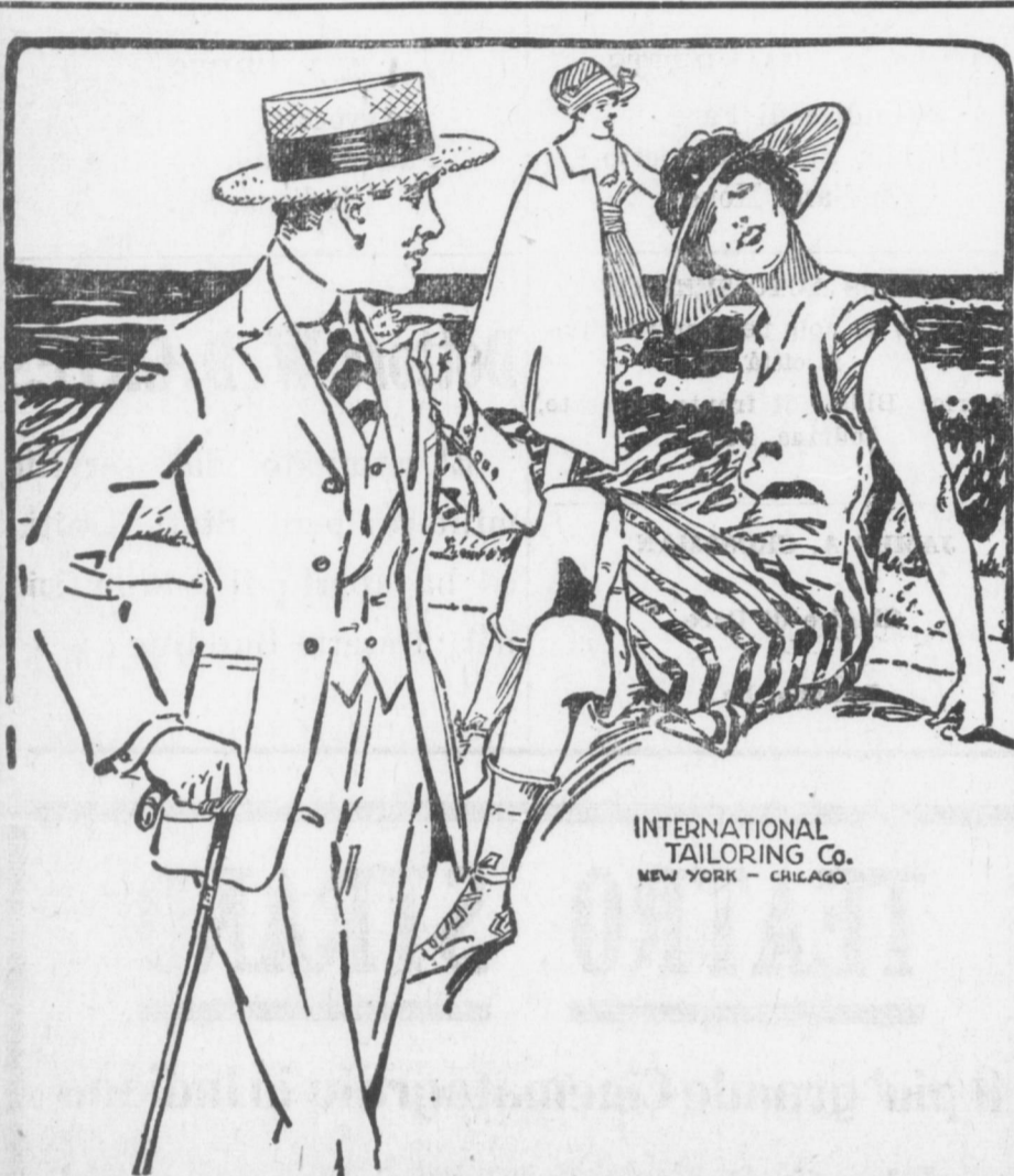
INTERNATIONAL TAILORING CO. NEW YORK - CHICAGO