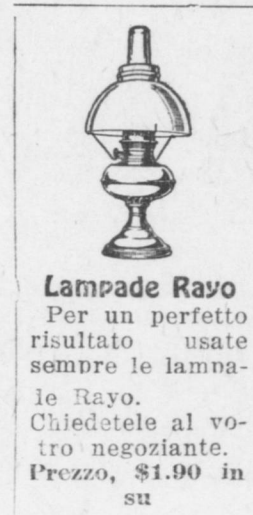
Lampade Rayo Per un perfetto risultato usate sempre le lampade Rayo. Chiedetele al vostro negoziante. Prezzo, $1.90 in su