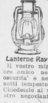
Lanterne Ray Il vostro migliore amico nell'oscurità e nelle notti tempestose. Chiedetele al vostro negoziante. Prezzo 50 soldi in su