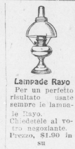
Lampade Rayo Per un perfetto risultato usate sempre le lampade Rayo. Chiedetele al vostro negoziante. Prezzo, $1.90 in su