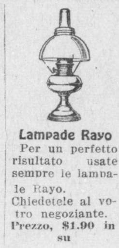
Lampade Rayo Per un perfetto risultato usate sempre le lampade Rayo. Chiedetele al vostro negoziante. Prezzo, $1.90 in su