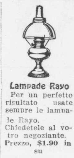
Lampade Rayo Per un perfetto risultato usate sempre le lampade Rayo. Chiedetele al vostro negoziante. Prezzo, $1.90 in su