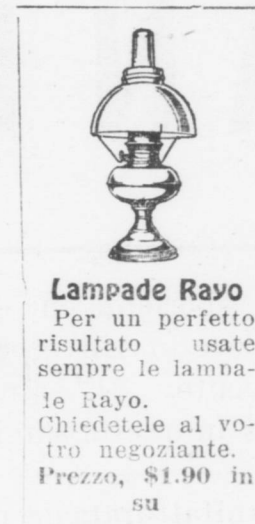
Lampade Rayo Per un perfetto risultato usate sempre le lampade Rayo. Chiedetele al vostro negoziante. Prezzo, $1.90 in su