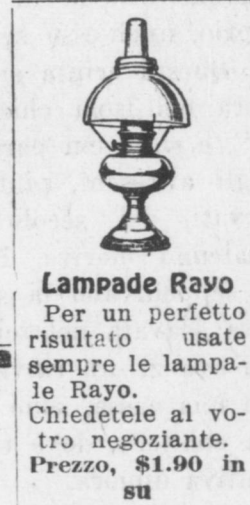
Lampade Rayo Per un perfetto risultato usate sempre le lampade Rayo. Chiedetele al vostro negoziante. Prezzo, $1.90 in su