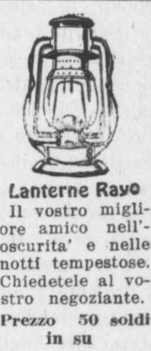
Lanterne Rayo Il vostro migliore amico nell'oscurità e nelle notti tempestose. Chiedetele al vostro negoziante. Prezzo 50 soldi in su