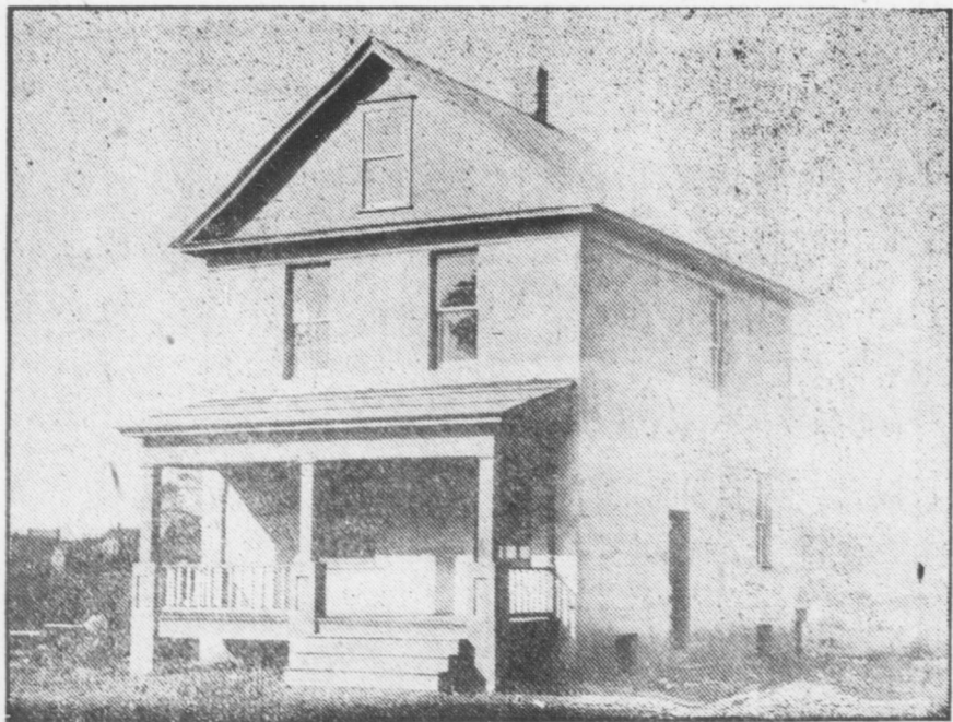
Casa a Mazza St., lotto, 50x110. Costruita di legno rivestita di speciali mattoni e spianata a cemento di fuori. Gas e acqua, rendita mensile, $12.00. PREZZO $2099.84.