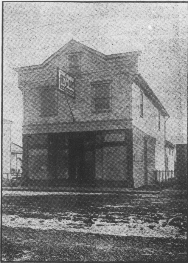
Storo a Green St., lotto 45x120, fabricato in legno 24x80. rendita mensile, $43.75. Prezzo della proprieta' $3559.38.