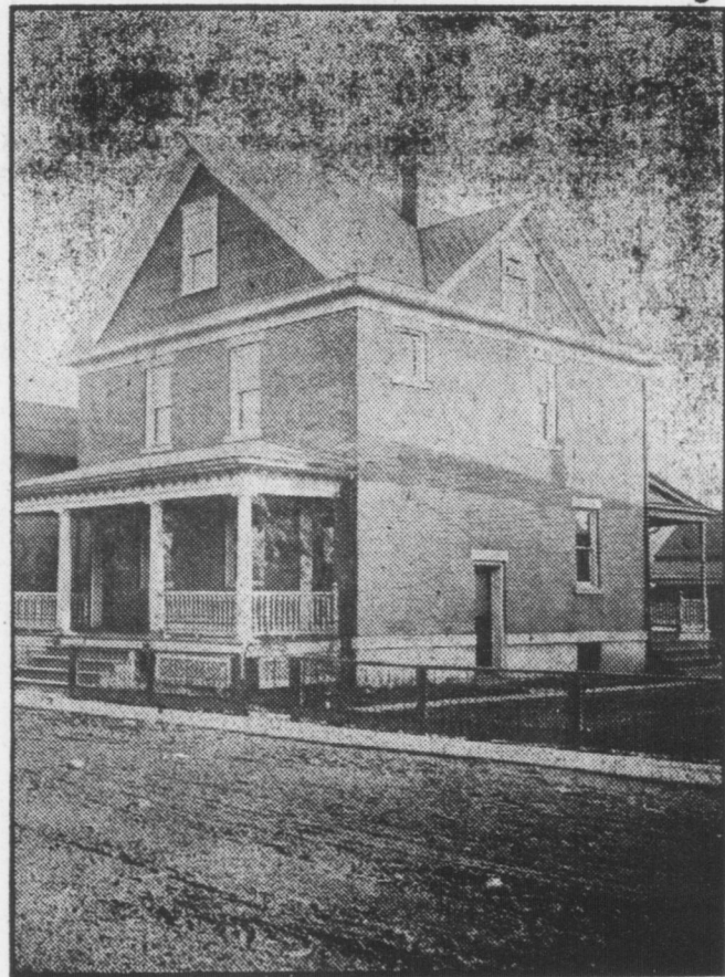
Residenza del Mazza a Green St., Casa costruita a solidi mattoni, contiene 12 stanze oltre la cantina lotto 55x120. Cesso, acqua, gas ed impianto elettrico. Inclusa la stalla 28x28 con pavimento a cemento comodita' per 3 cavalli e per automobile; spazio per 5 tonnellate di fieno, magazzino per biada, acqua ed ascensore per salire materiale al secondo e terzo piano. PREZZO $5,990.51.