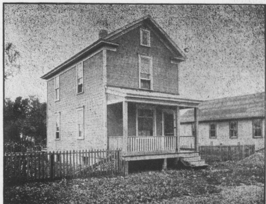
Casa a Mazza St., lotto 50x110. Fatta in legno con cantina, acqua, gas, rendita mensile $10. Si' vende per $1220.26.