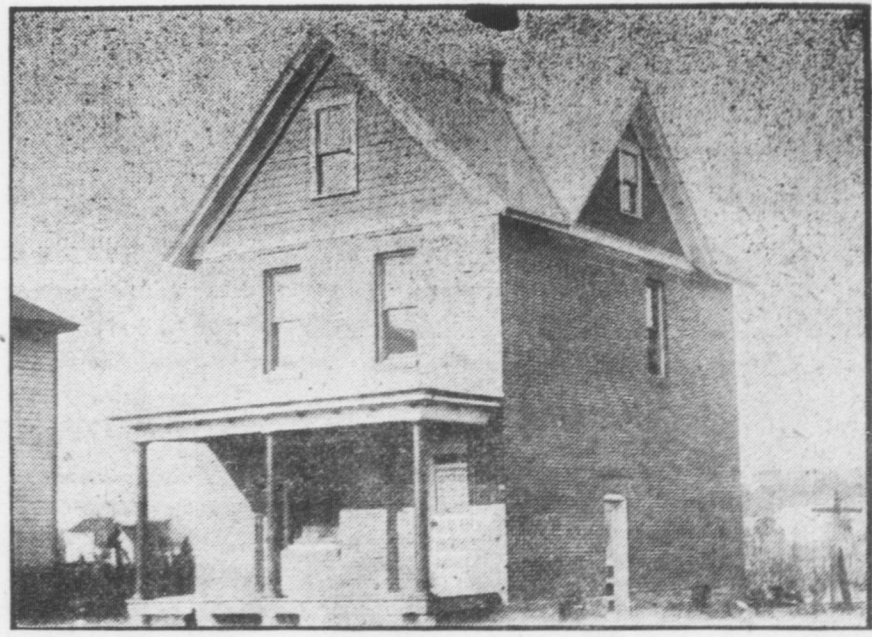
Casa a Mazza St., lotto 50x110 costruita a mattoni solidi cantina e tetto di lavagna, acqua e gas. Rendita mensile $12.00, PREZZO DI VENDITA $2126.83.

Per migliori Schiarimenti e per affari rivolgetevi a