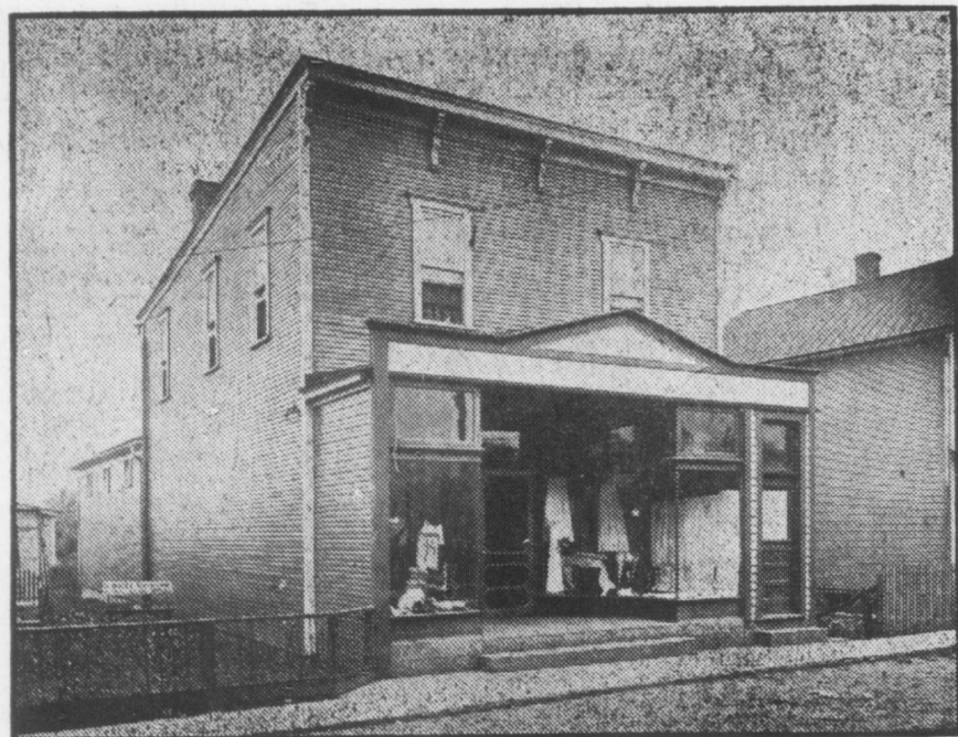
Storo a Green St., lotto 35x120, fabricato in legno 24x80. Rendita mensile $37.00, si vende per $2698.08