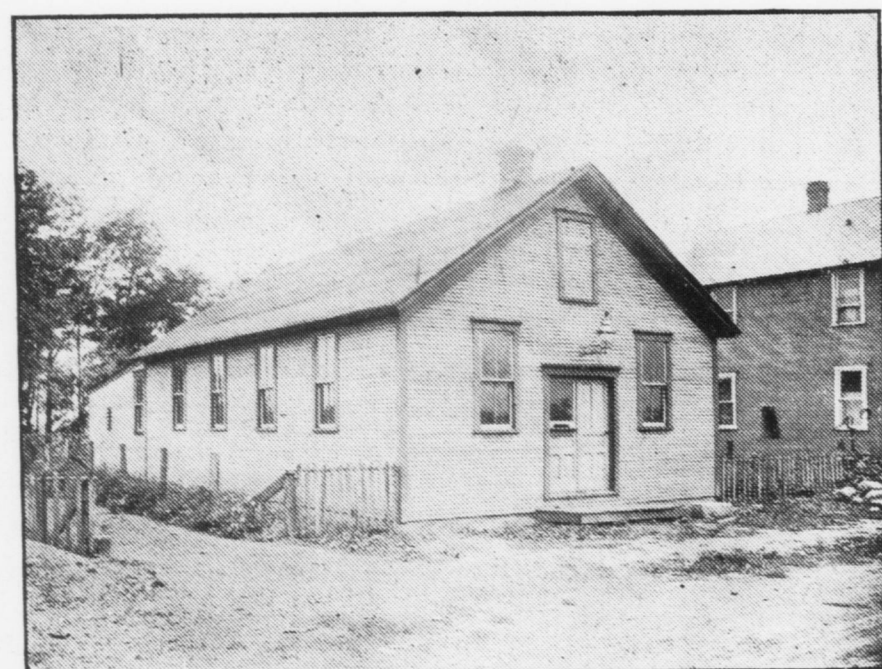
N.o 9 — Casa per uso di riunione 24x60 $778,80.