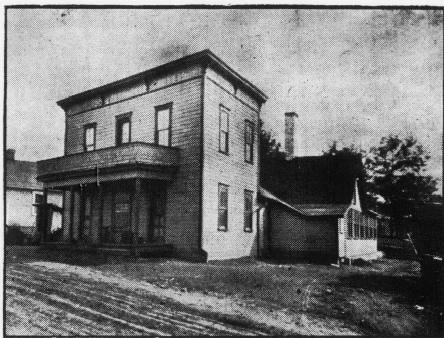
N.o 8 — Casa di fronte alla fattoria $750,00