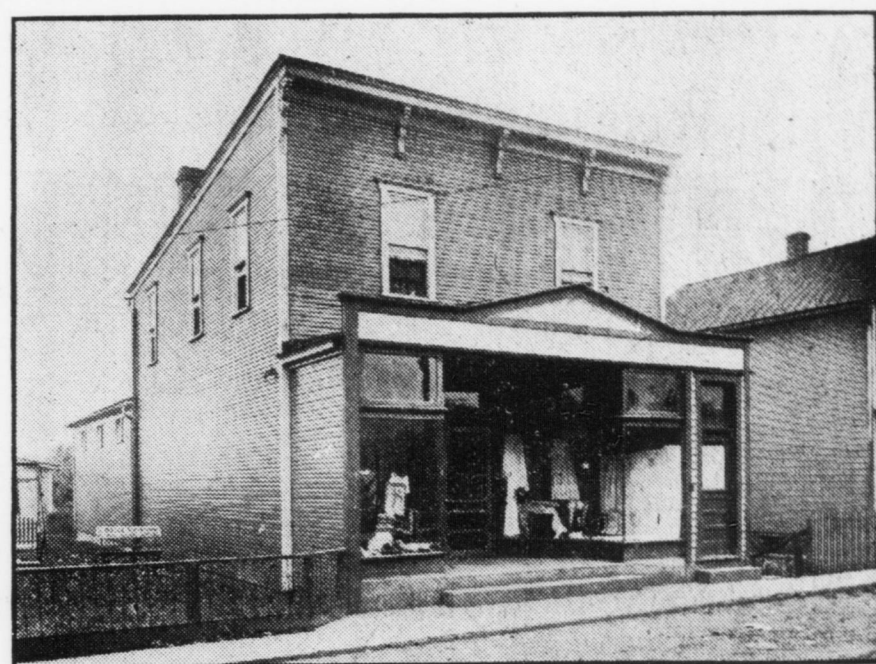
N.o 2 store 24x76, lotto 35x120, gas ed acqua $2572,31