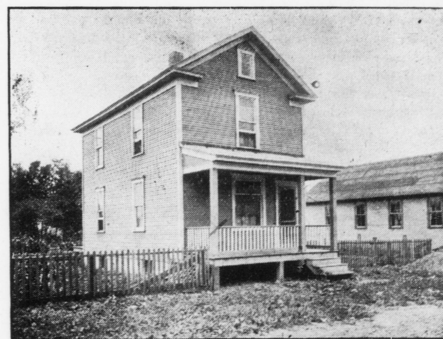
N.o 7 — Casti con due lotti $1275,92.

No. 1—Casa a mattoni coperta con tegole marsiglies, con gas, acqua in tutta la casa, cesso, stalla 28x28 con acqua e pavimento in cemento, lotto 55x120, $5564,75.