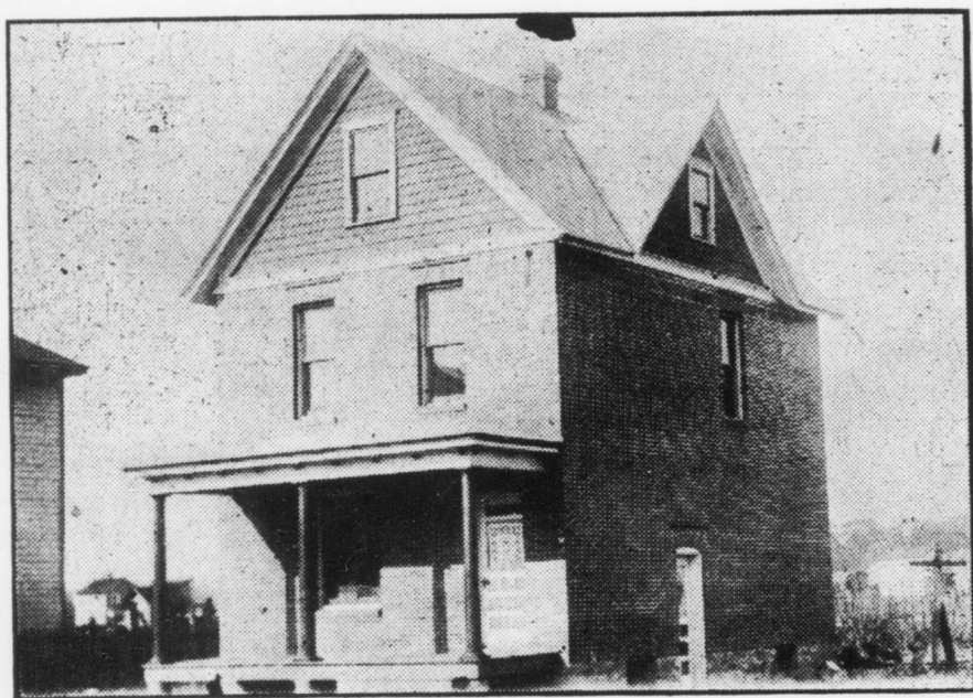
N.o 4 — Casa a mattoni solidi lotto 50x110 $1951,45

Il Mazza ha pure un lotto del valore di $500,00, un lotto in Indiana del valore di $200 e dodici lotti a Mazza street, che offre ai compratori con lo stesso sconto sopra indicato Per ogni miglior schiarimento rivolgetevi a GIUSEPPE MAZZA, Homer City, Pa.