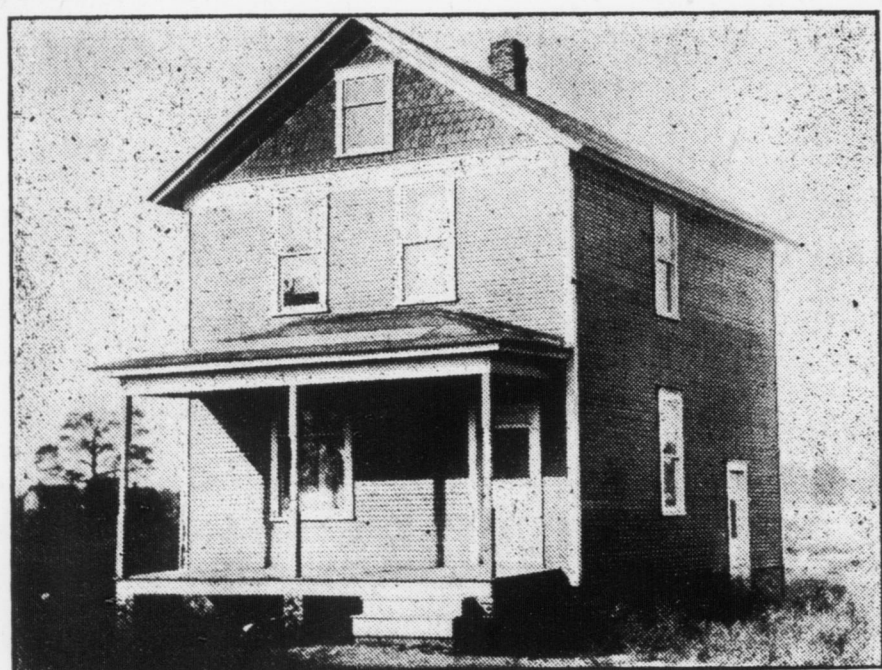
N.o 6. — Casa di legno con cantina $1396, 50.

N.o 3 — Casa a mattoni bianchi che non figuru fra queste, con un lotto 60x200 con tutte le moderne comodità $2295,00.