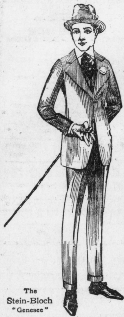
The Stein-Bloch "Genesee"