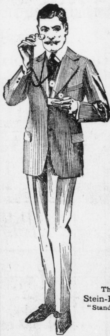
The Stein-Bloch "Standard"

Voi potete liberamente lasciare i vostri pacchi e ogni altra cosa da noi, mentre aspettate i carri.