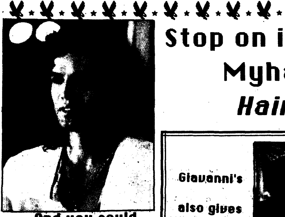
And you could go from this

Best Commercial - The Budweiser Commercial with the three frogs.